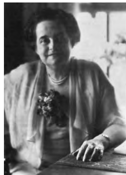
Alice A. Bailey

Dans les temps modernes, ces enseignements ont été transmis principalement par l'intermédiaire d'Helena Petrovna Blavatsky, l'une des fondatrices de la Société Théosophique, entre 1875 et 1890. Son livre, la Doctrine secrète , représente la partie préparatoire de l'enseignement pour le nouveau cycle cosmique dans lequel nous entrons actuellement, et que nous appelons l'ère du Verseau. Une autre partie fut transmise ultérieurement par l'intermédiaire d'une disciple anglaise, Alice A. Bailey, entre 1919 et 1949, par un Maître tibétain, Djwhal Khul. Cette partie est considérée comme la phase intermédiaire des enseignements transmis par les Maîtres pour le nouvel âge. Un autre ensemble d'enseignements, les Enseignements de l'Agni Yoga, fut donné par l'intermédiaire d'une autre disciple russe, Helena Roerich, entre 1924 et 1939.