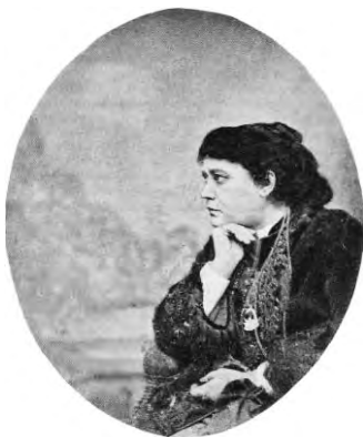
Helena Petrovna Blavatsky

BC. Celui, très connu, de Djwhal Khul, le Maître tibétain qui a donné au monde les enseignements transmis par Alice A. Bailey. De 1919 à 1949, il lui dicta par télépathie mentale, une série de 19 ouvrages (auxquels s'ajoutent les cinq livres qu'A. Bailey écrivit elle-même). Ces enseignements très profonds et, à mon