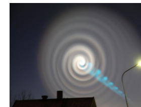
9 décembre 2009, spirale de lumière dans le ciel de la Norvège le matin.

partout dans le monde, de jour comme de nuit, et qui annoncerait l'imminence de la première interview télévisée de Maitreya aux États-Unis, sur un réseau majeur.