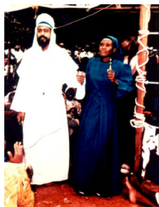
Apparition de Maitreya à Nairobi photo du Kenya Times, 1988

Depuis plus de trente cinq ans l'écrivain et conférencier Benjamin Creme prépare la voie pour le plus grand événement de l'histoire : « l'émergence » de Maitreya l'Instructeur mondial, et de son groupe, les Maîtres de Sagesse ».